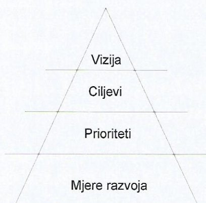
Slika 1: Strategija razvoja pojedinih općina/gradova

Ovaj dio sadrži najvažniji dio Mape razvoja općine ili grada. Prilog 2 – Mjere Mape razvoja Općine Cetingrad sadrži razrađene mjere razvoja navedene općine. Mjere razvoja predstavljaju konkretizaciju strategije, tj. ciljeva i prioriteta u pojedinoj općini. Bez njih planirani razvoj ne bi imao konkretno uporište, te se u konačnici ne bi ni ostvario. One u stvarnosti predstavljaju projekte koje treba provesti. U piramidalnoj strukturi mjere su jedini opipljivi i vidljivi dio strategije razvoja pojedine Jedinice lokalne samouprave.