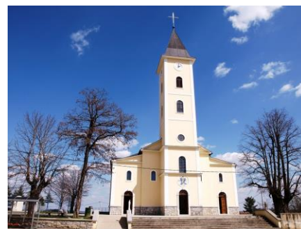
- crkva Uznesenja BDM -