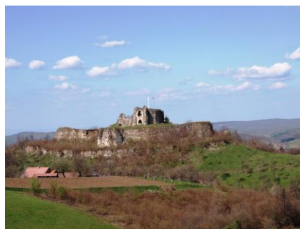
- stari grad Cetin -