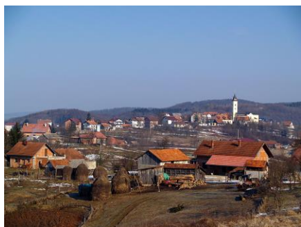
- Četingrad - panorama -

(Četingrad – Bilo – Cetin – Četingrad – Klokoč – Maljevac - Četingrad)